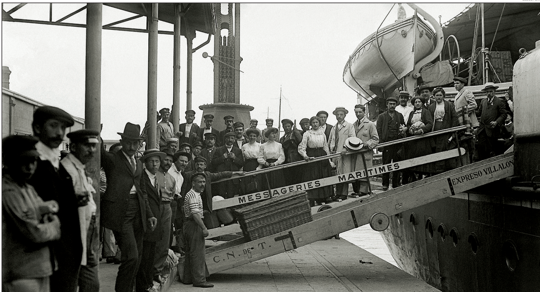
PAIS DE INMIGRANTES. El puerto de Buenos Aires a principios del siglo XX. El lugar donde comenzó a forjarse la identidad multicultural de la Argentina.

*Escritor, periodista, abogado. Candidato al Parlasur por Cambiemos.