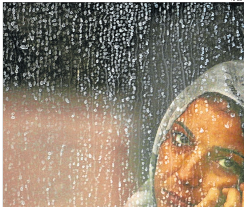
LOS TRENES DE HUNGRÍA. Muchos que huyen desde Oriente encuentran en los trenes que van paralelos al Danubio un camino hacia la libertad. Sin embargo, en Hungría, un gobierno xenófobo los repele, funcionando casi como un escudo del continente hacia los migrantes que llegan desde Asia.