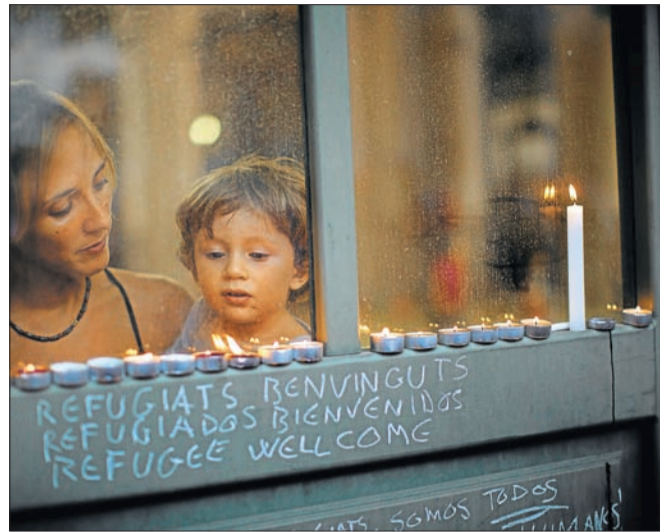
SOBREVIVIR. A la izquierda, unos niños juegan en una estación de Macedonia, camino a Serbia. Arriba, una madre española y su hijo de dos años encienden unas velas por los refugiados. Abajo, agua para inmigrantes, en Grecia.

Merkel. Es el reconocimiento más significativo de que los alemanes, gracias a su sistema político, a su eficiencia económica, a su capacidad de respetar las reglas, han conquistado una verdadera hegemonía que, como lo ha escrito Antonio Gramsci, es un conjunto de consenso y fuerza. Según los sondeos del eurobarómetro, 80% de los ciudadanos de la Unión Europea (y todos los países de Europa fueron invadidos por la Alemania nazi) tienen mucha confianza en los alemanes. La difícil política de recepción de los migrantes en muchos países de la Unión Europea va a cambiar bajo la leadership de Alemania, que ya acoge millones de turcos y de migrantes que vienen de los Balcanes.